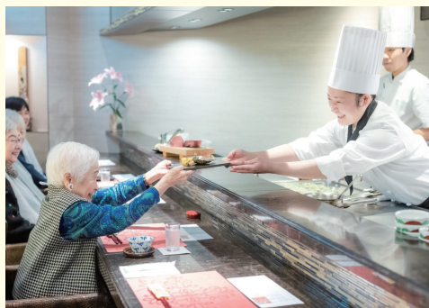
■和・洋・中 選べる6つのレストランとメニュー