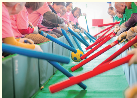
■365日愉しめるアクティビティやイベント